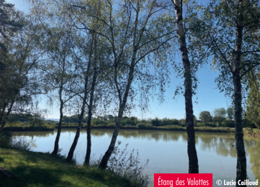
Étang des Valottes