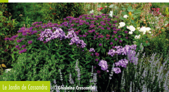
Le Jardin de Cassandra

1 route de Forge 71390 SAINT-MARTIN-D'AUXY Ouverture : du 18 mars au 12 novembre de 14 à 18 h (10h-12h par forte chaleur). Tarifs : 5€ - Gratuit pour les moins de 12 ans 06 88 01 59 70 - www.jardincassandra.fr