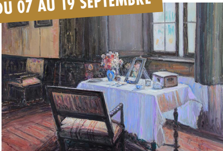
ROBERT FICHOT PEINTURE À L'HUILE