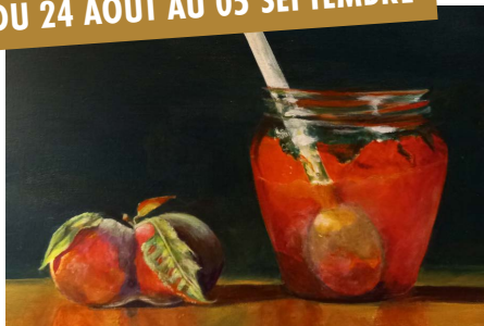
CLAUDE MAZUY PEINTURE