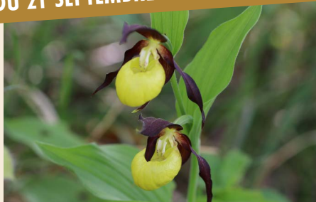
MAURICE BLANCHARD PHOTOGRAPHIE