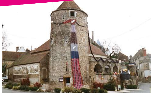
SOCIÉTÉ D'HISTOIRE ET D'ARCHÉOLOGIE DE BUXY