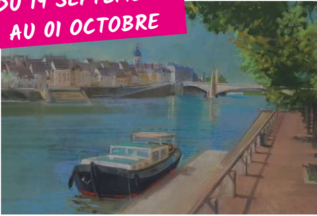
PIERRE BRETIN Paysages en Bourgogne PASTELS