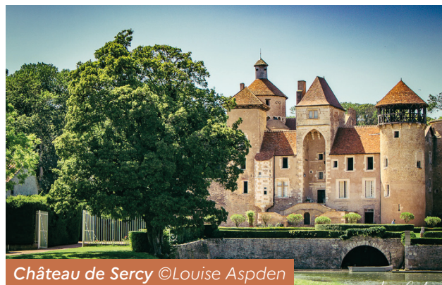
Château de Sercy