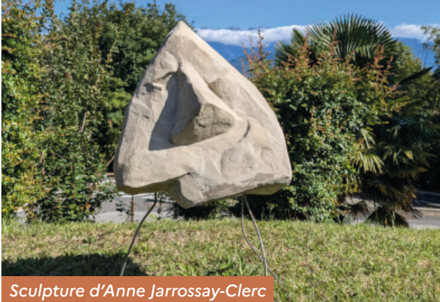
Sculpture d'Anne Jarrossay-Clerc