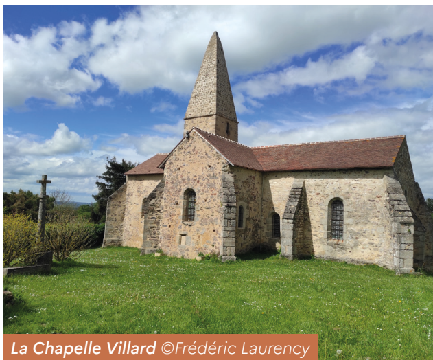
La Chapelle Villard