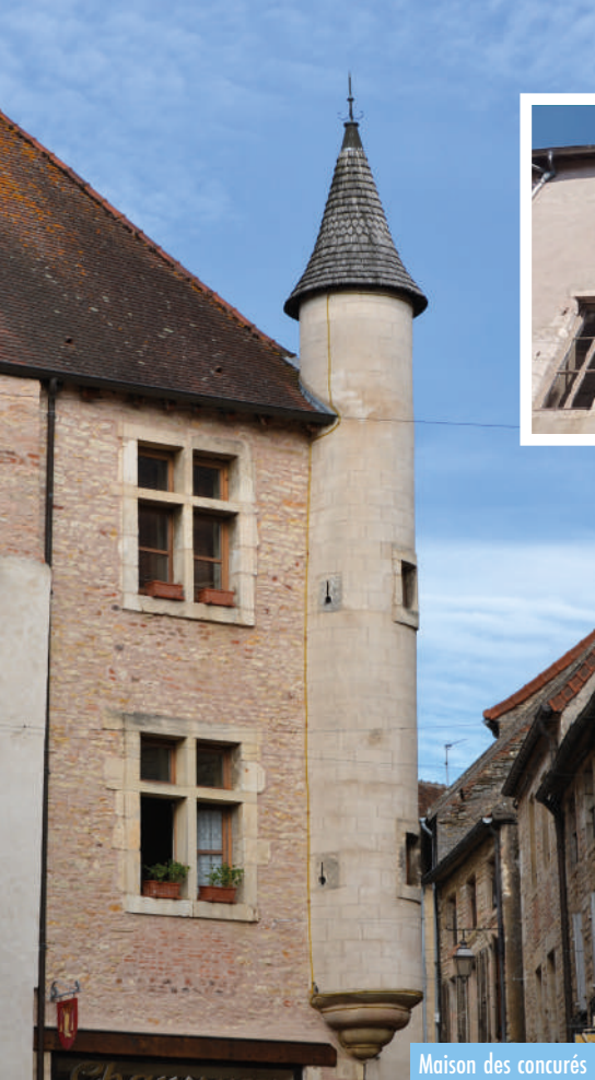
Maison des concurés