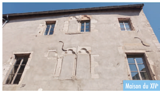
Maison du XIV e