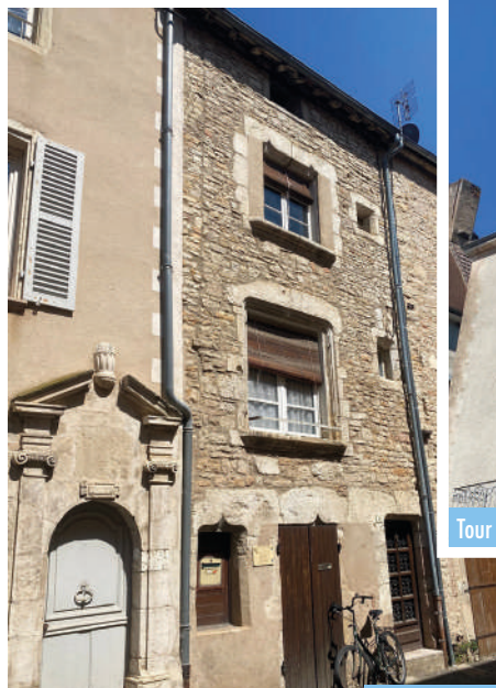
Maison du XV e

Une maison à tour d'escalier, aux formes irrégulières, domine cette place. Elle se situait probablement sur la première enceinte de la Cité.