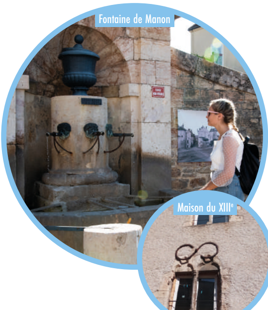
Maison du XIII e