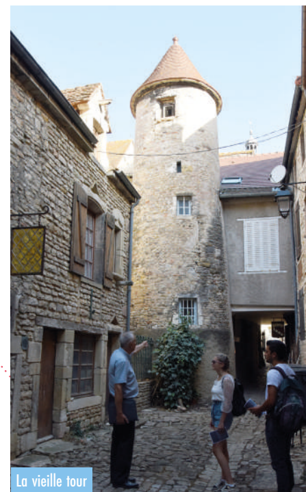
La vieille tour