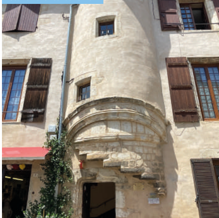
Escalier à encorbellement

Ce magnifique escalier à vis se trouve dans une maison typique du XVI e siècle.