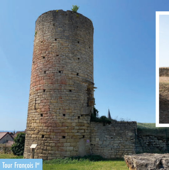
Tour François I er