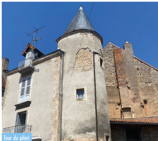
Tour du pilori

La tranquillité et le charme de cette place ne doivent pas faire oublier qu'au Moyen Âge, la justice royale avait besoin d'un pilori pour être rendue.