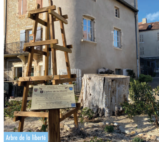
Arbre de la liberté

Après la Révolution, un « arbre de la liberté » fut planté en 1792. Le chêne fut remplacé en 1802 par un marronnier qui faisait partie des arbres remarquables de Bourgogne. Malheureusement, ce marronnier bicentenaire, trop malade, a été abattu en 2017.