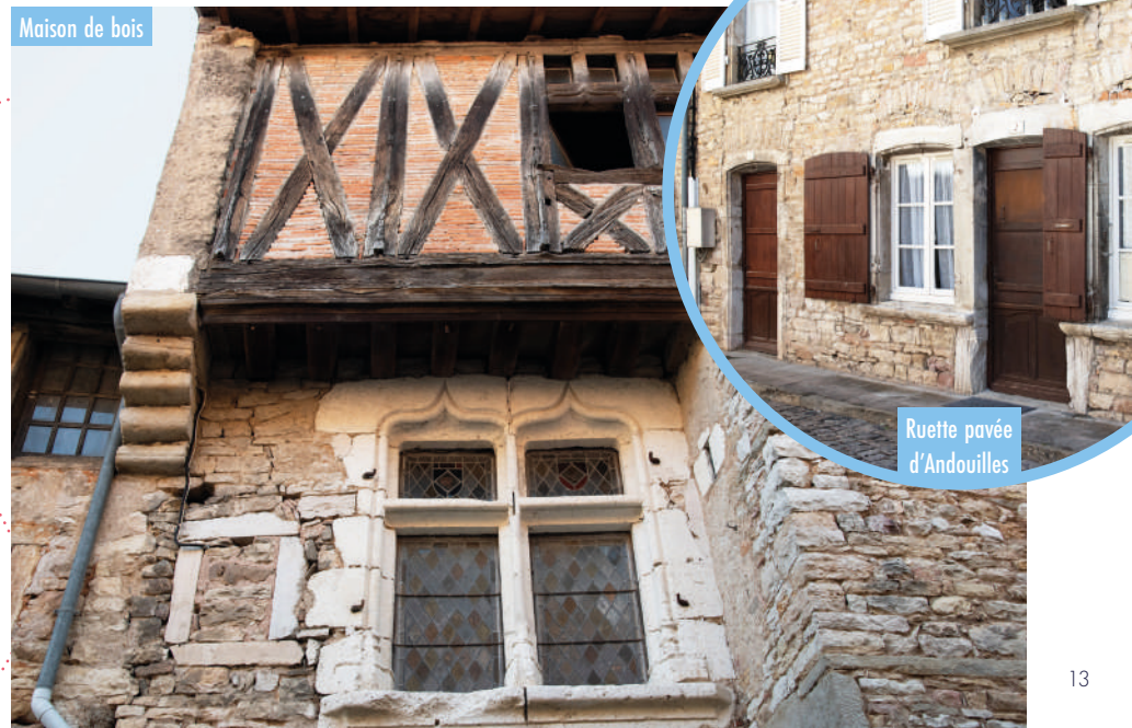
Ruette pavée d'Andouilles