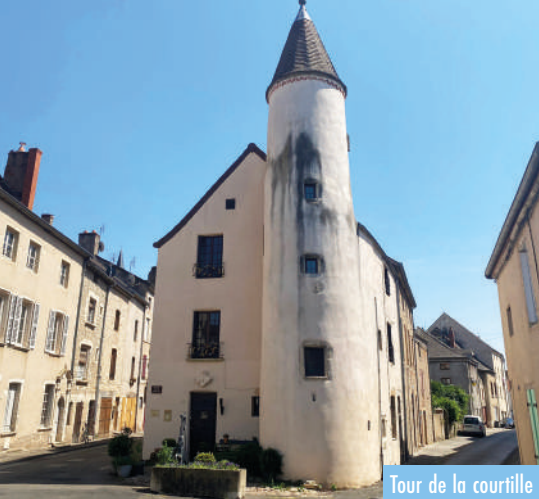
Tour de la courtille