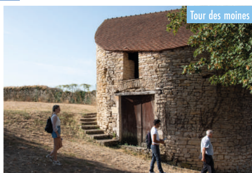
Tour des moines

Elle était de la même hauteur que la Tour François Premier, mais son diamètre était plus important. Elle logeait autrefois des militaires. On peut voir des « meurtrières », des archères transformées en canonières.