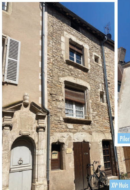
XV e Huis

Dit plein wordt gedomineerd door een onregelmatig gevormd huis met een traptoren. Het stond waarschijnlijk op de eerste ommuring van de stad.