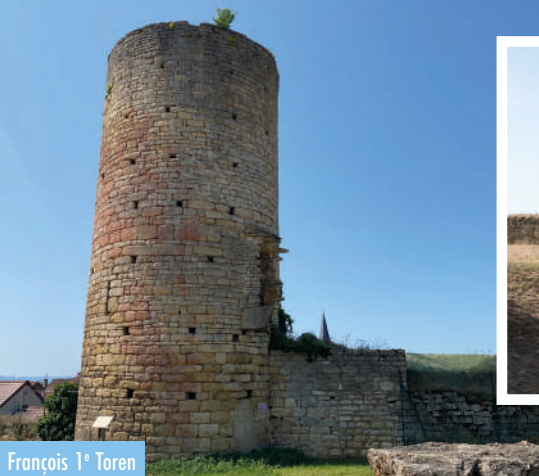
François 1 e Toren