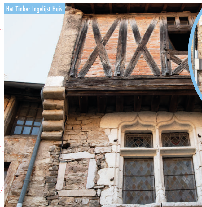
Het Timber Ingelijst Huis

Dit gebouw in flamboyante gotische stijl is te zien vanaf zowel de rue des Moutons als de rue du Moulin à Cheval. De Bourgondische vakwerkarchitectuur dateert uit het tweede kwart van de 15e eeuw, terwijl de funderingen dateren uit 1410.