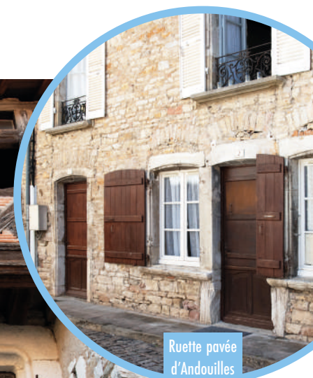
Ruelle pavée d'Andouilles

Andouilles are non-conforming, unsaleable cobblestones from the production of sandstone cobblestones in the Saint-Gengoux region. They were then donated to neighboring communes.